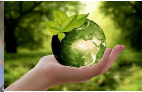
Tri et recyclage