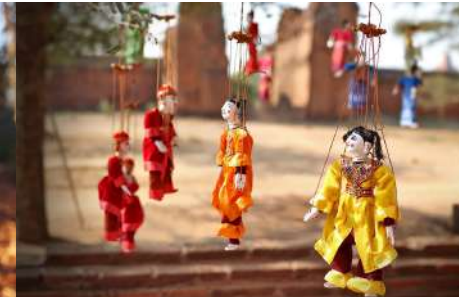
Théâtre et/ou Marionnettes