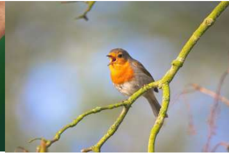
Les 5 sens de la Nature