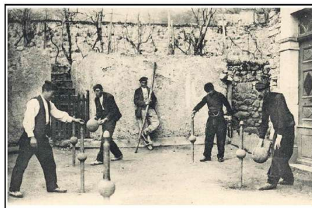
Patrimoine naturel et historique en Chausson