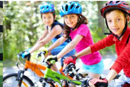
Vélo et environnement