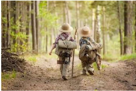
La vie en pleine Nature