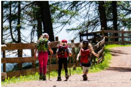
Sports de plein air